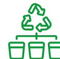
Tri des déchets