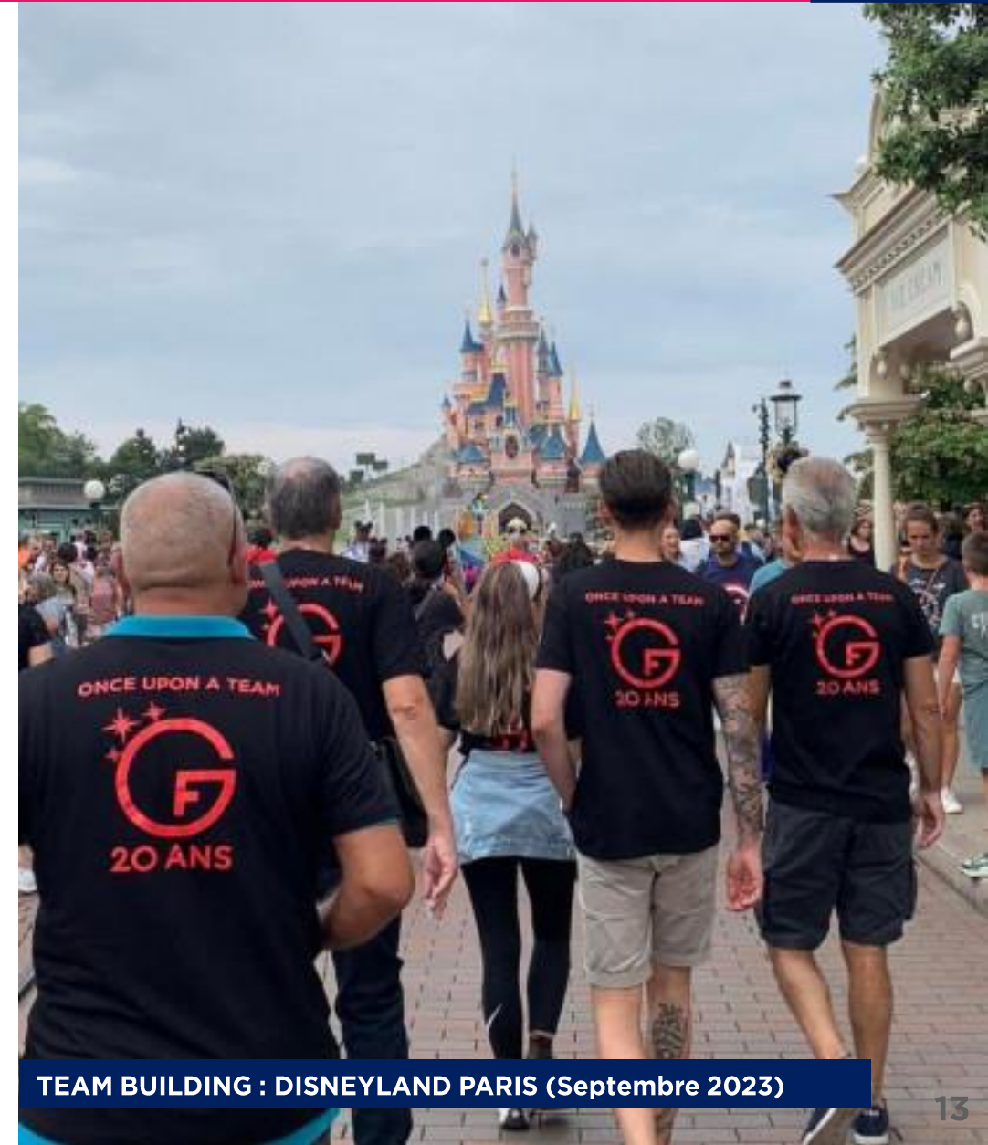
TEAM BUILDING : DISNEYLAND PARIS (Septembre 2023)