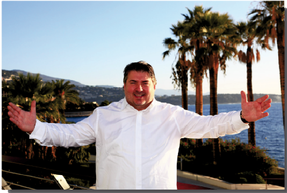
Alain Llorca, Un Chef étoilé vous invite à sa table

Nous vous l'annonçons depuis quelques mois, l'ouverture du Café Llorca Monaco est sans nul doute l'un des événements majeurs de cet hiver 2010. Le Grimaldi Forum Monaco se démarque ainsi une nouvelle fois de ses concurrents internationaux en devenant l'un des seuls centres de congrès et de culture à proposer la cuisine d'un chef étoilé, celle du célèbre Alain Llorca.